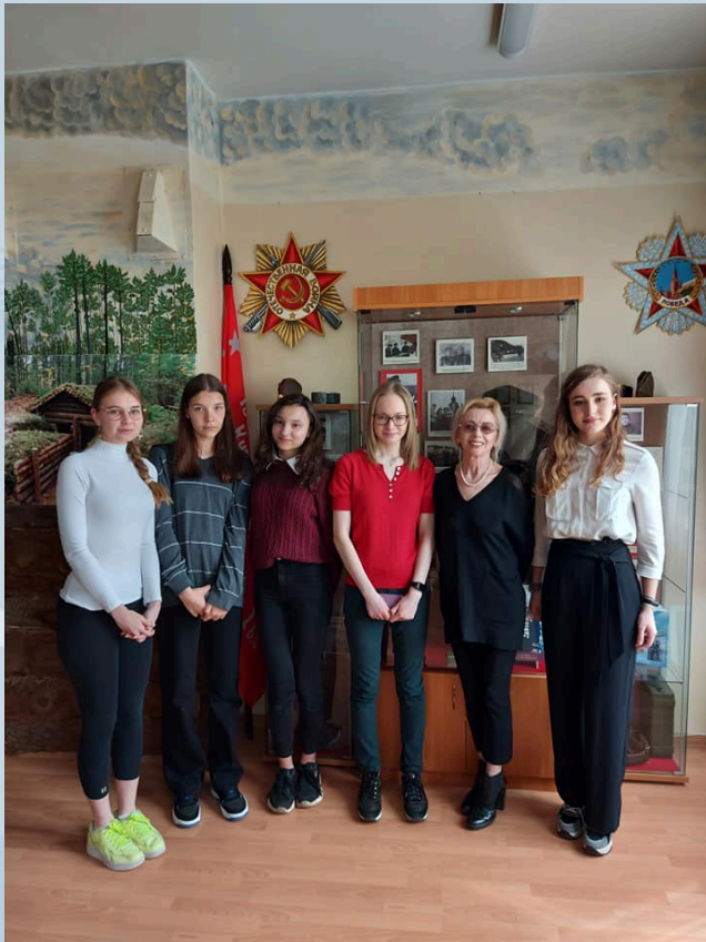
Гиды Москвы на французском языке

представить результаты исследований в области истории, литературы, научных открытий на городских конкурсах и международных конференциях в рамках реализации городского предпрофессионального проекта «Новый педагогический класс в московской школе»