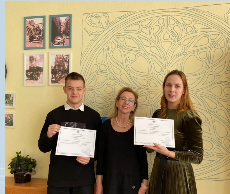
Участники Билингвального проекта, 2021 год